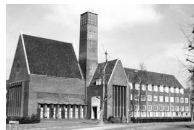
Leger Des Heils