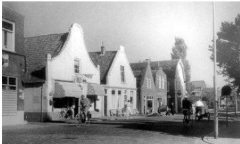
Dorpsstraat, Patattent Pel