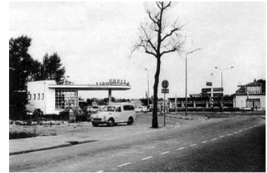
Kruising Van Sonweg

De Amsterdamseweg volgen en dan het dorp Amstelveen met de oversteek van de Burgemeester Van Sonweg, wat een klap