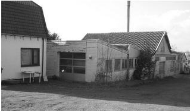
Werkplaats Oom Henk

geraas van de dijk rolt en tegen de Meidoornhaag tot stilstand komt. Ik schrik van de vallende flessen en de 2 melkbussen en maak dat ik wegkom. Honderd meter verder woont Opa en heeft oom Henk een plaatwerkerij.